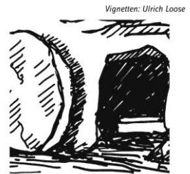
Ostern: Liebe leben