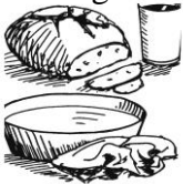
Gründonnerstag: Liebe teilen

Ludwigslust 19.00 Uhr Abendmahlsmesse, anschließend Agape im Gemeindehaus. Bitte Brot dazu mitbringen. 21.30 Uhr Ölbergstunde in der Pfarrkirche, anschließend Nachtanbetung „Wachet und betet“ in der Marienkapelle bis 7.00 Uhr. Eine Liste zum Eintragen wird ausgelegt.