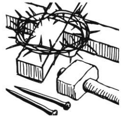
Karfreitag: Liebe leiden