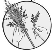
Palmsstecken zu Palmsonntag

Freitag, 03. April, um 19.00 Uhr in der Pfarrkirche